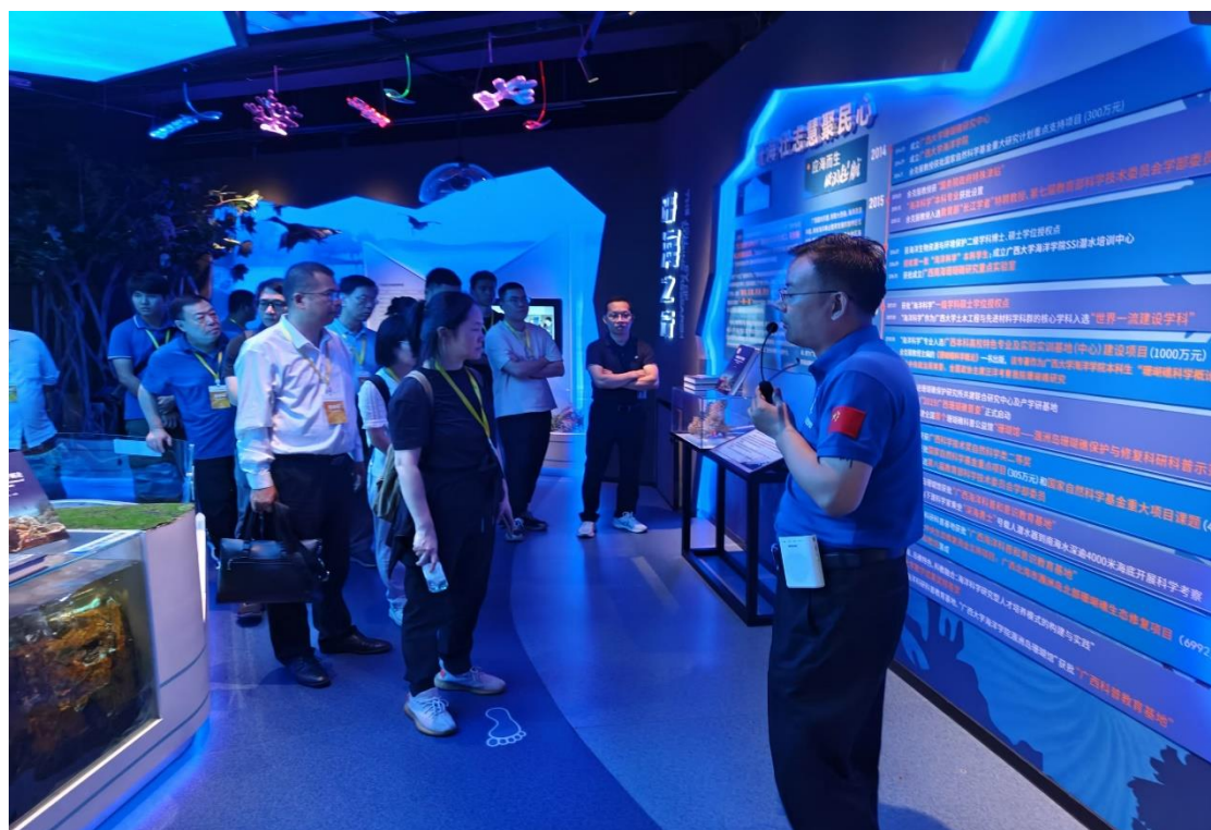
中国精神残疾人及亲友协会主席赵新玲访问我院

10月22日，广西高校科协工作培训班的学员们参观广西大学海洋科教馆。常务副馆长李周佳向来宾们介绍了珊瑚礁生态系统在全球的分布和生存现状，着重强调了珊瑚礁生态系统对于地区环境经济的重要意义以及学院依托平台开展的科普服务。随后，他讲述了广西大学海洋学院的发展历程，回顾了近十年来学院在科研上取得的丰硕成果，以及在维护南海生态环境方面所做出的贡献。广西高校科协工作培训班的学员们围绕着场馆的科普工作展开了热烈的讨论和交流。他们纷纷表示，希望能与广西大学海洋科教馆进行深入的合作，共同推动科普事业的发展。