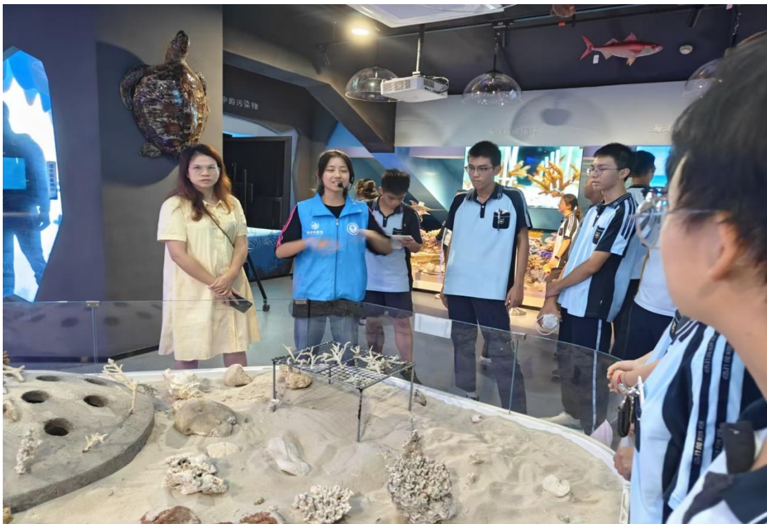
广西大学附属中学研学来访（10月21日）