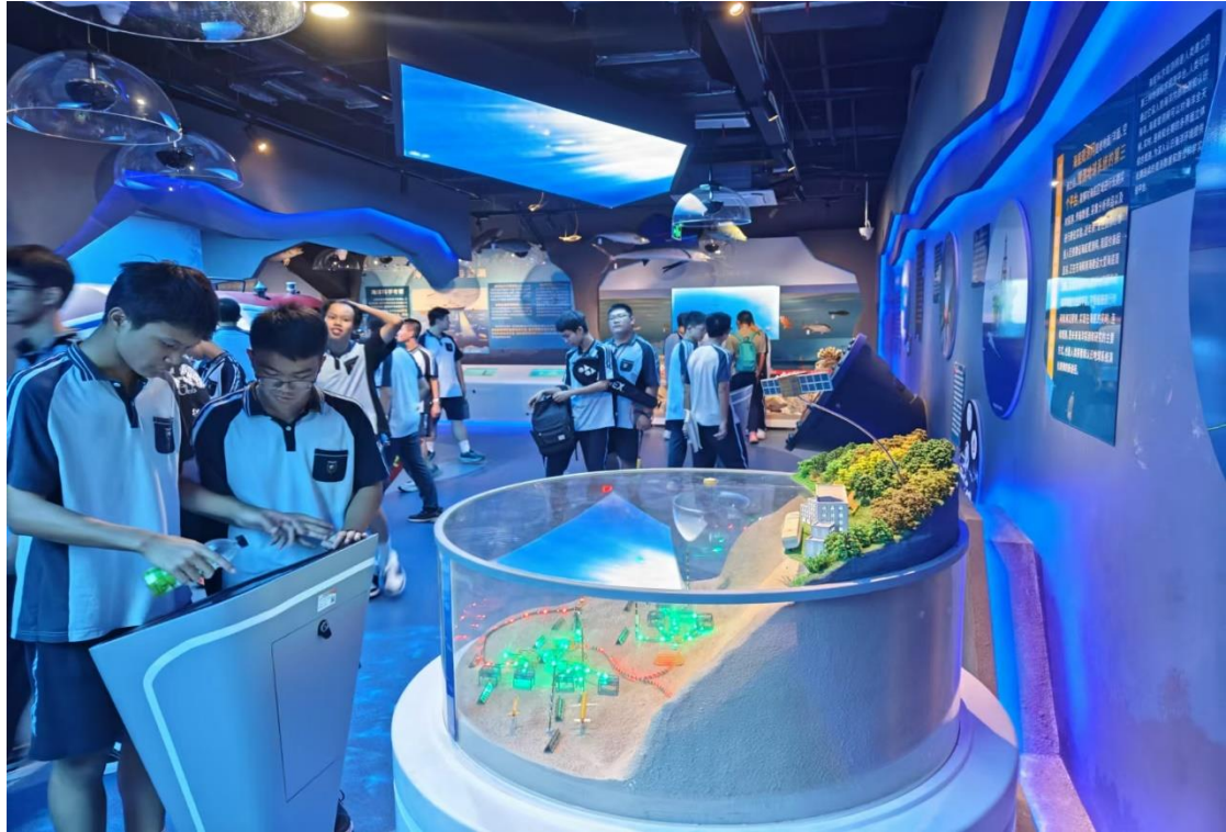
广西大学附属中学研学来访（10月14日）