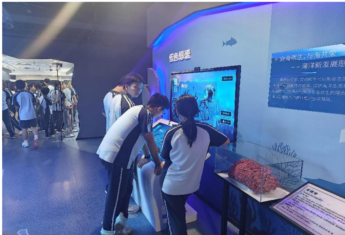
广西大学附属中学研学来访（10月12日）